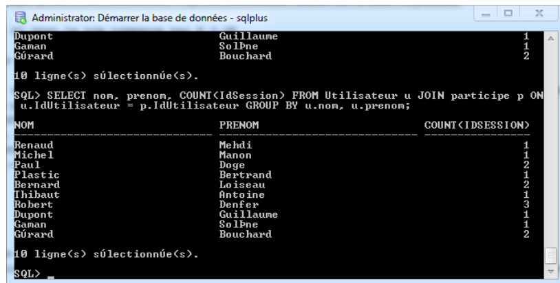
Le résultat d'une requête envoyée à la base de données.

Nous avons rencontré quelques problèmes dans cette vérification, notamment avec des erreurs inconnues qui nous ont pris longtemps à diagnostiquer.